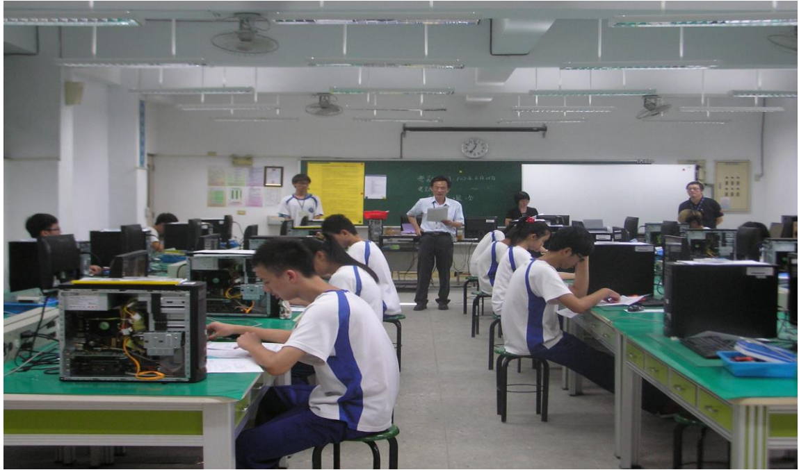
電腦網路架設丙級檢定