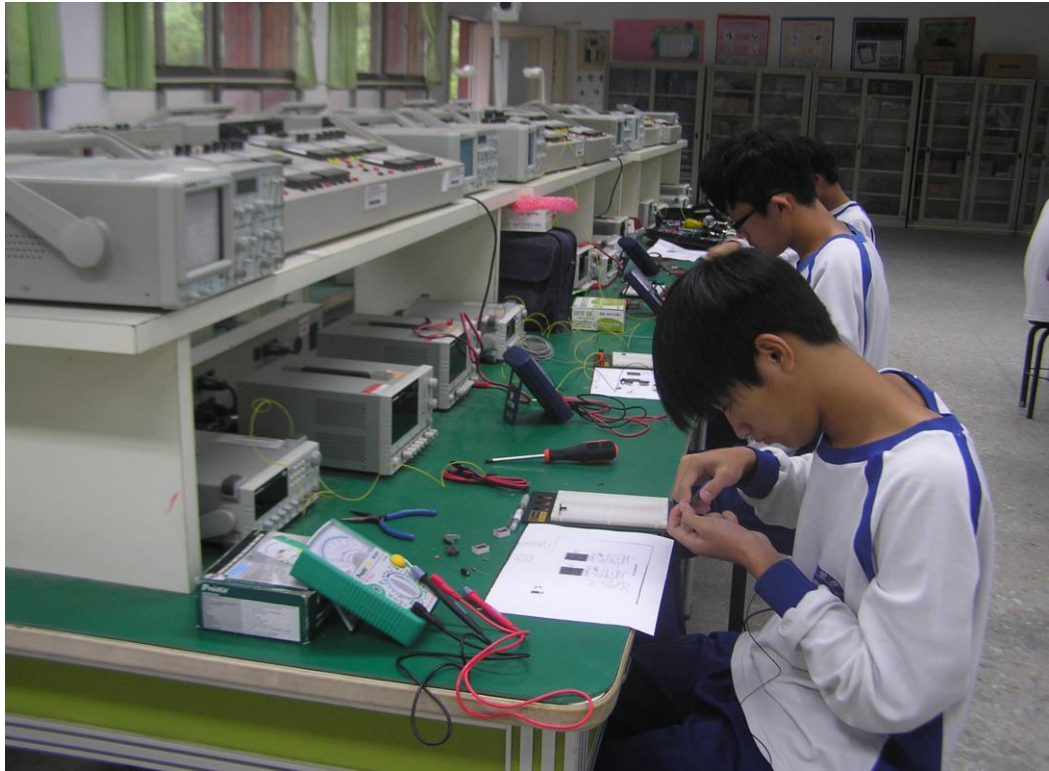
電腦硬體裝修丙級檢定