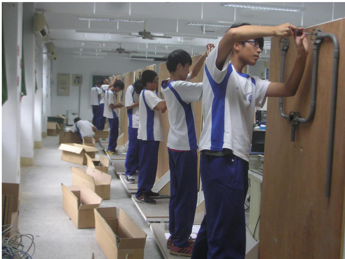
電腦硬體裝修乙級輔導