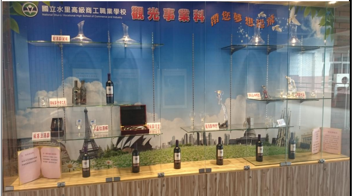
104 學年度觀光科藝文櫥窗展示紅酒文化於行政大樓 4 樓。