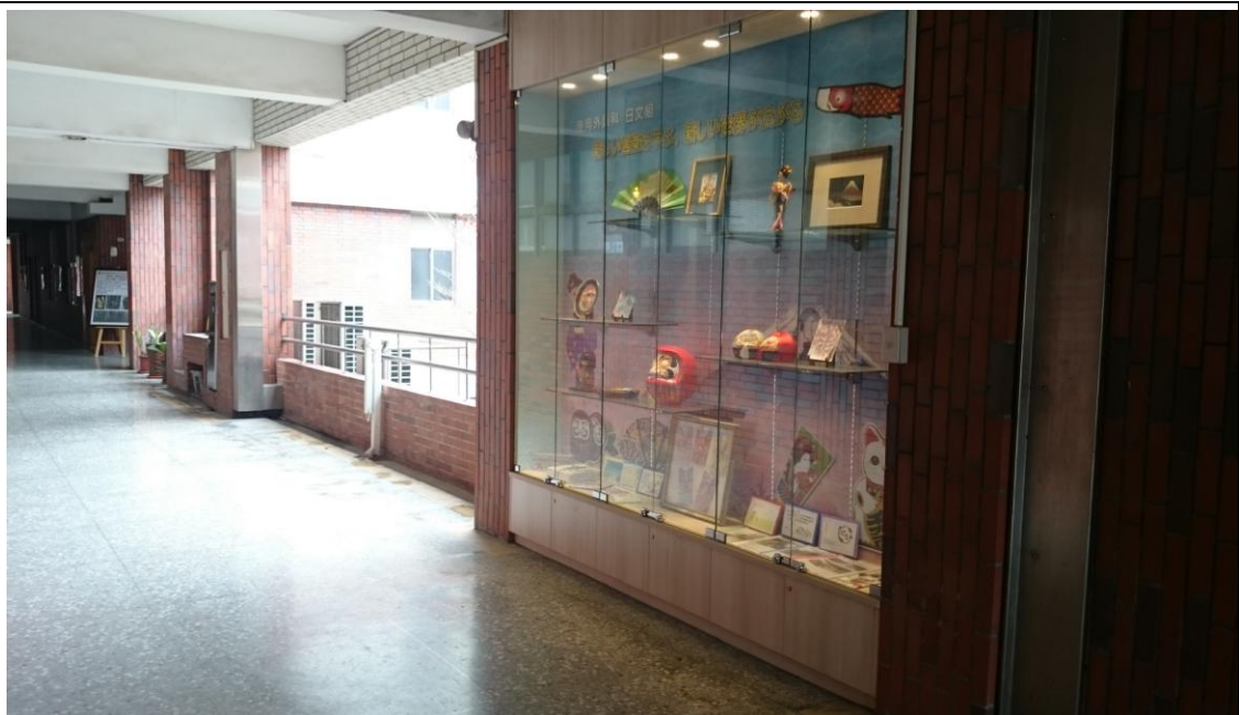
104 學年度應用外語科日文組藝文櫥窗展示歷年來赴日教育旅行交換紀念品。