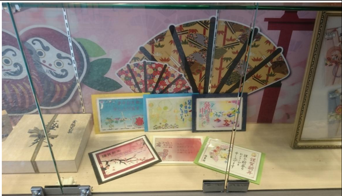
104 學年度應用外語科日文組藝文櫥窗展示學生製作的日文卡片設計作品。