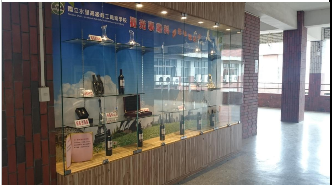
104 學年度觀光科藝文櫥窗展示紅酒文化情景照片。