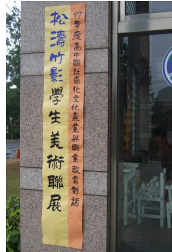
「松濤竹影」活動海報、字幕