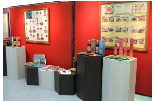
本校藝文中心紅樓雅集