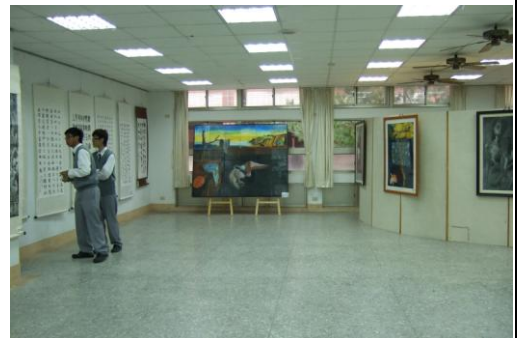
「松濤竹影」展覽會場學生欣賞情形

(7) 2009 年擬定社區化計畫辦理「梅竹入扇」水墨研習營活動邀請水墨名家程雪亞老師至本校指導同仁畫竹梅。