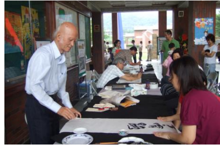
柯耀東大師示範教學情形

(9) 2009年6月辦理水里商工美學新藝境活動邀請藝術家到學校風景寫生示範並與全校學生分享創作心得