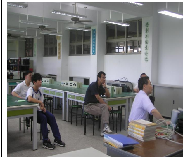
照片說明：參加研習人員