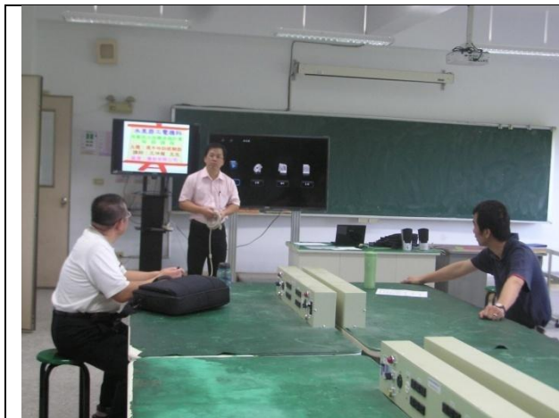
照片說明：授課講師