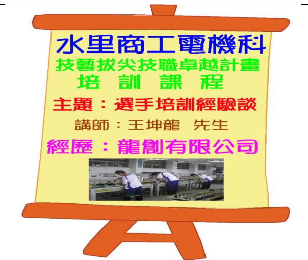
照片說明：研習海報