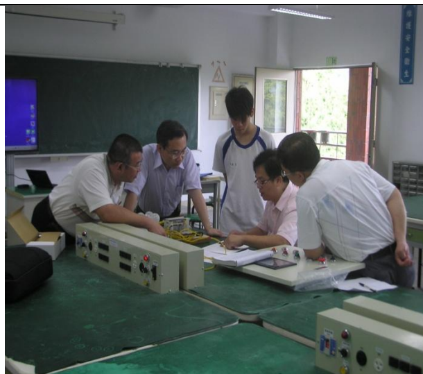
照片說明：授課講師實作講解