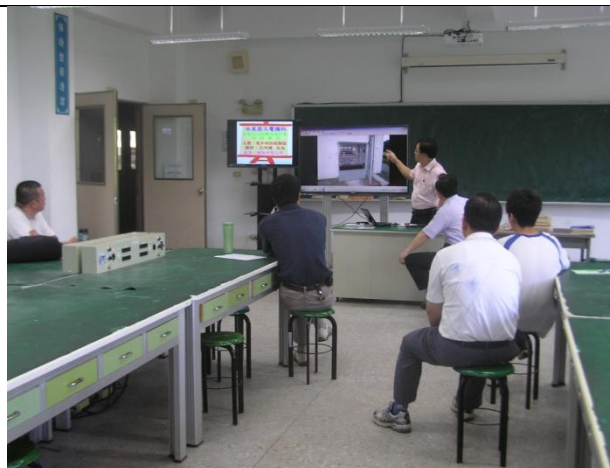
照片說明：授課講師講課情況