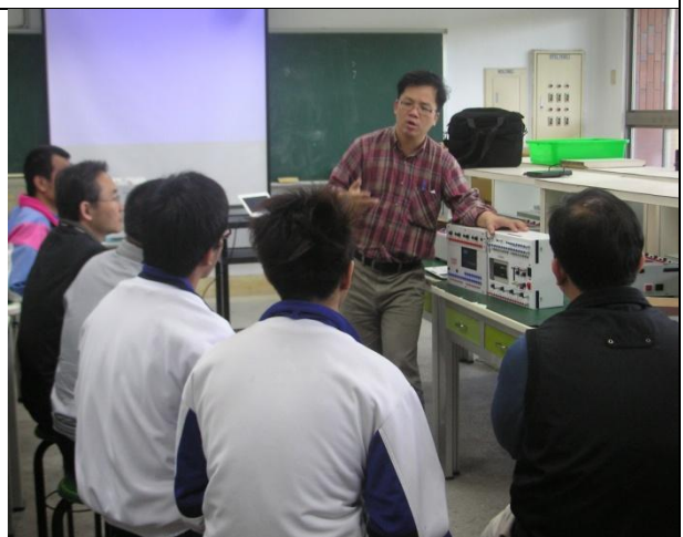
照片說明：研習情況