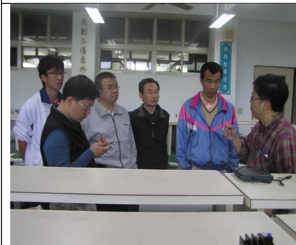
照片說明：研習情況