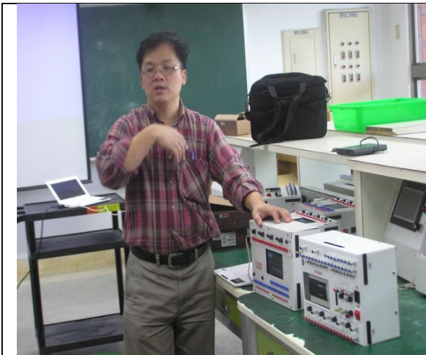
照片說明：授課教授