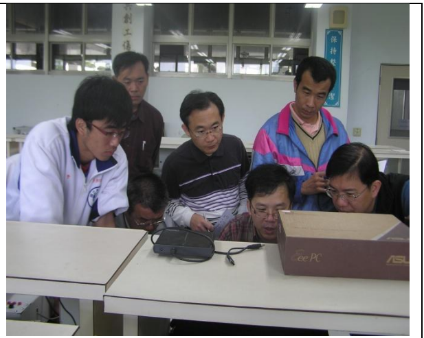
照片說明：參加研習同仁