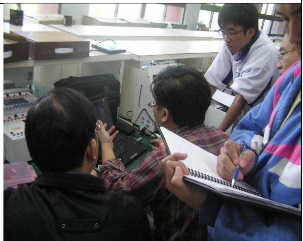
照片說明：研習情況