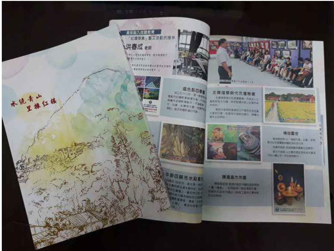
國立水里商工校刊《情繫紅樓》，勇奪全國競賽三大獎。