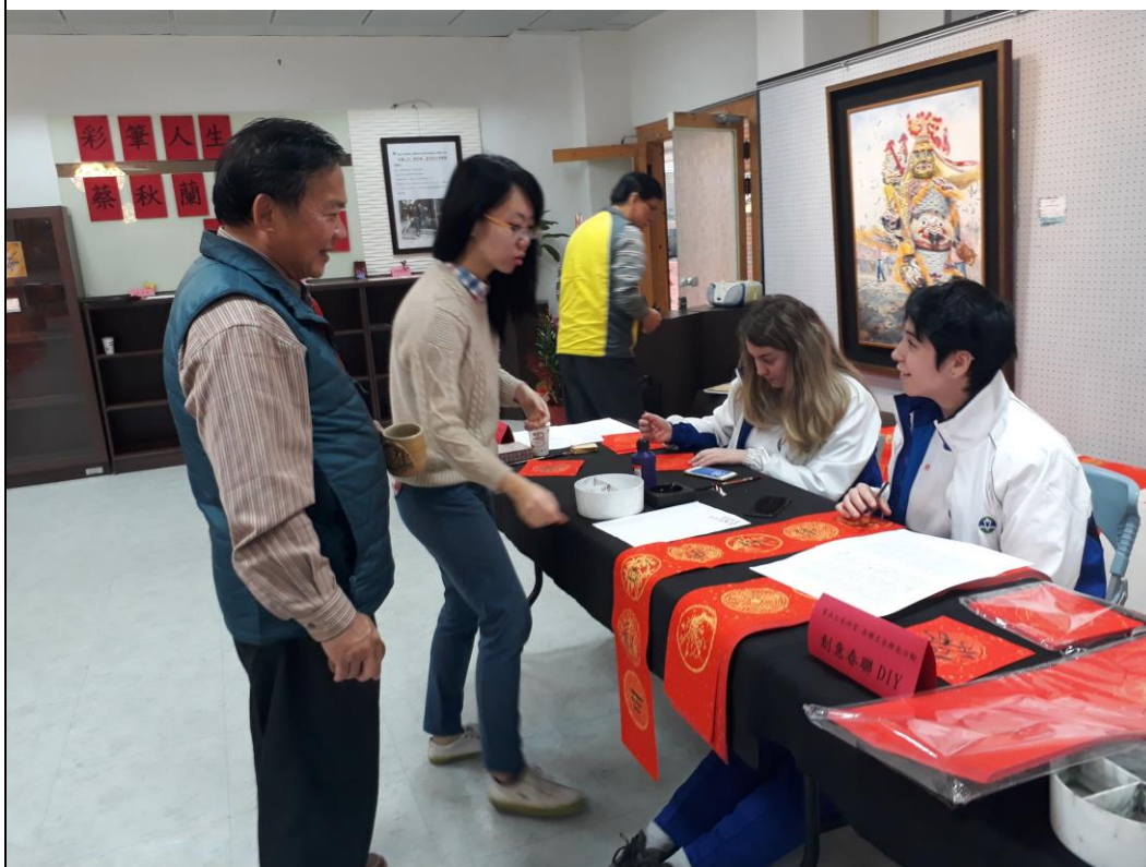
106.12.29 外籍生春聯 DIY，校長探視情景。