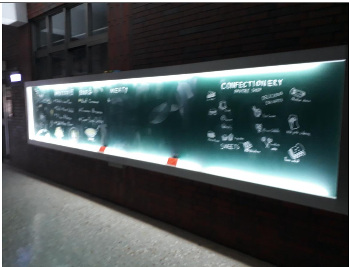
107. 12. 28 餐飲科走廊藝文展示台。