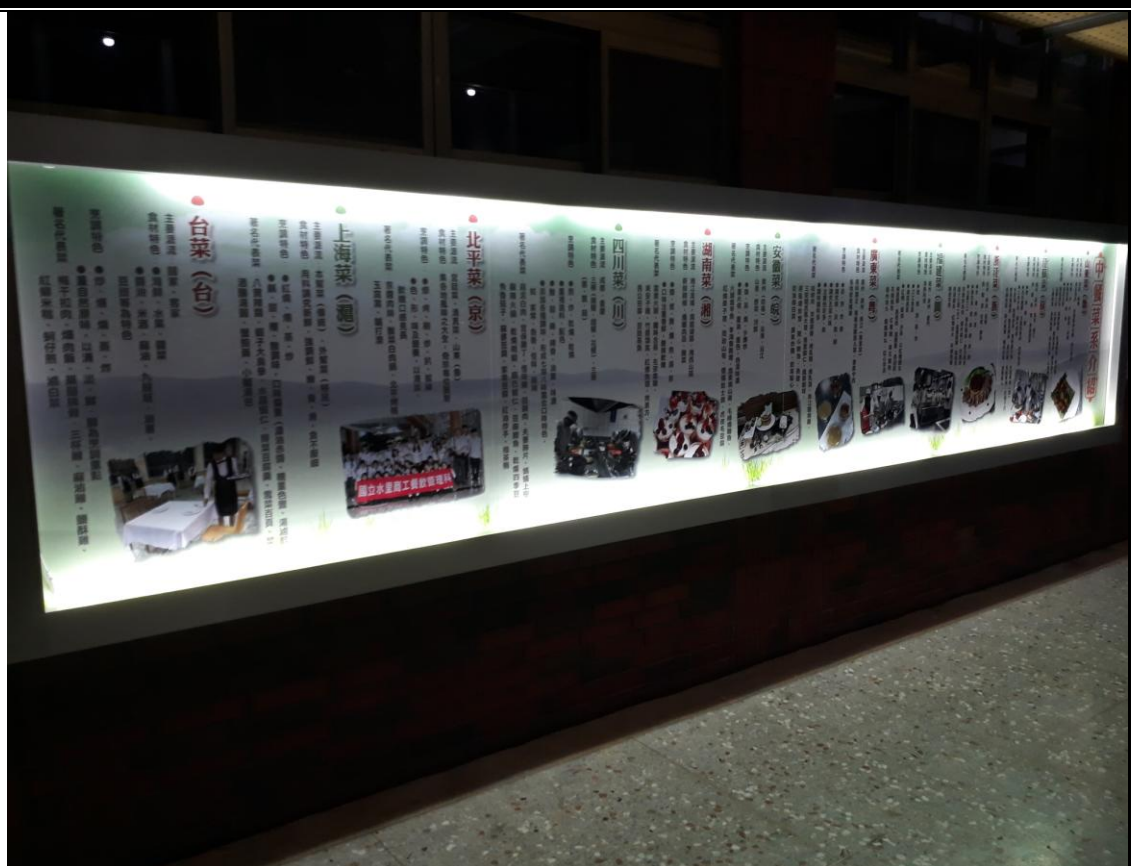
107. 12. 28 餐飲科走廊另一座藝文展示台。