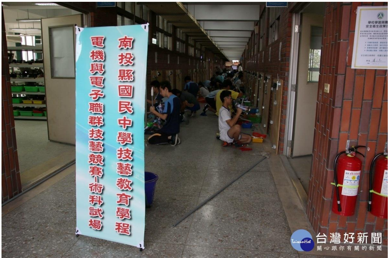
水里商工舉辦國中電機電子群技藝競賽會場。

今年參與的國中有水里、國姓、北梅、大成、同富、南投、宏仁、草屯、竹山、中興、名間、集集、旭光、埔里、大成等合計 15 所國中報名，計 58 位選手參賽。比賽當日 08:20 各國中帶隊老師與學生陸陸續續進行報到及抽籤，早上 9:20 進行術科實作室內配線 150 分鐘，成績佔 80%；下午 13:20 進行學科測驗 40 分鐘，成績佔 20%，兩測驗分數依佔分比例及時間快慢評定名次，競爭相當激烈，學生無不卯足勁，求得佳績，為校爭