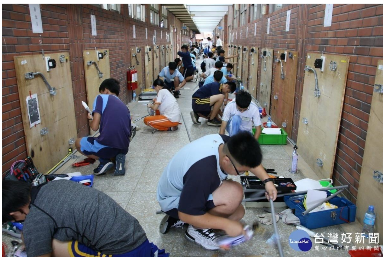
國中電機電子群技藝競賽於水里商工比賽室內配線情景

南投縣 107 學年度國民中學技藝教育學程-電機、電子職群技藝競賽，12 日於國立水里商工電機科舉行，這次競賽是由南投縣政府教育處主辦，水里商工承辦。凡是縣內國中九年級學生選讀電機、電子職群技藝教育課程的學生均可透過校內遴薦報名參加，期望透過這項比賽加強國中學生學習