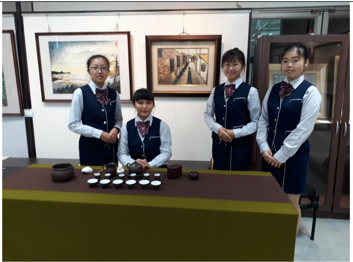
108年6月5日施顯澤畫展，觀光科二年級同學茶席服務。