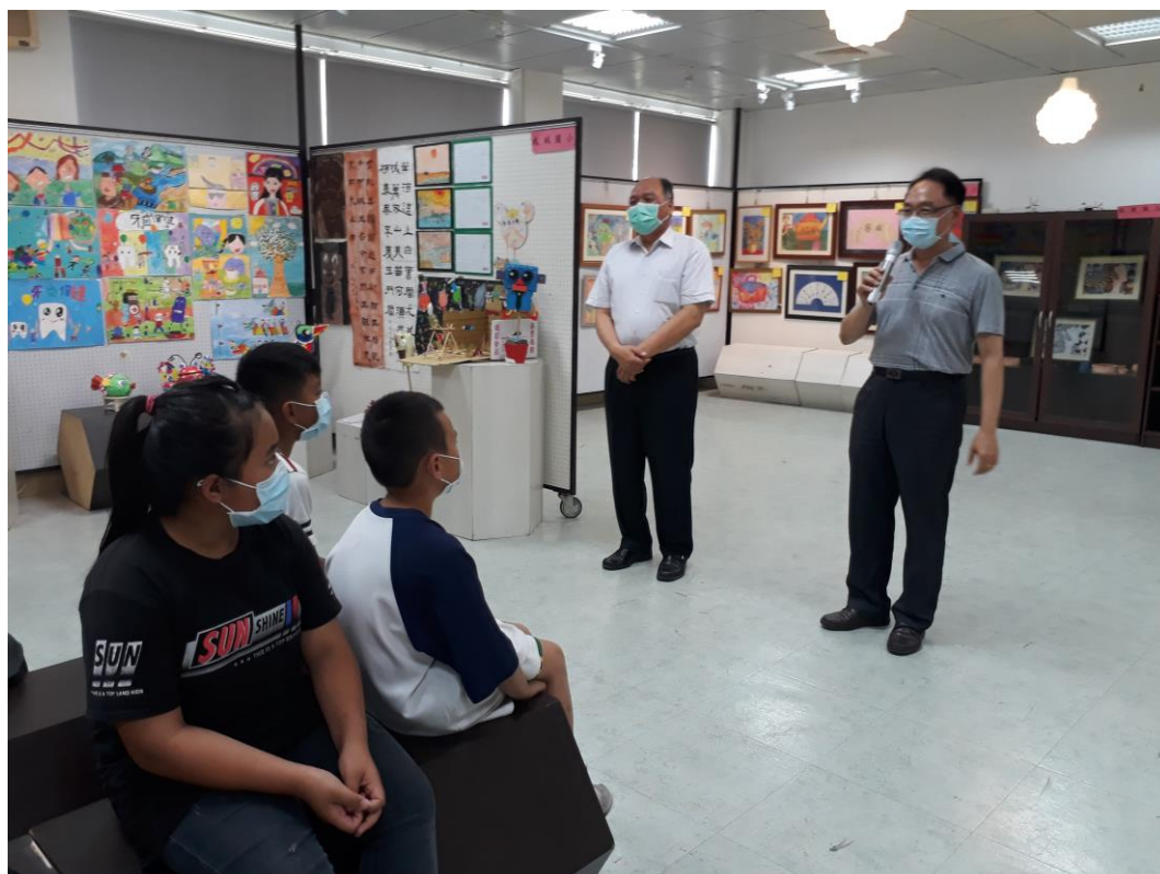
109年5月8日水里鄉各級學校學生聯合美展，民和國小學童參觀，國教署卓檢任視察情景蒞臨指導。