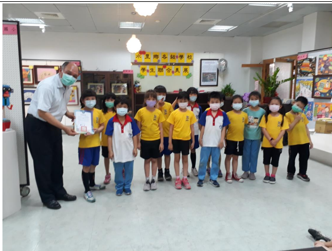
109年5月5日水里鄉各級學校學生聯合美展，徐校長頒發參展證書給水里國小學童。