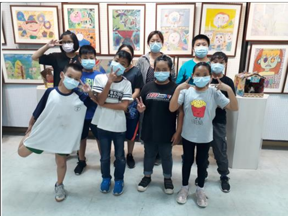
109年5月8日水里鄉各級學校學生聯合美展，民和國小學童參觀情景。