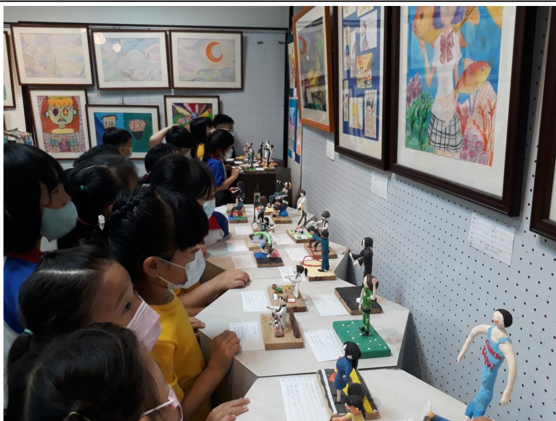
109年5月9日水里鄉各級學校學生聯合美展，水里國小學童參觀情景。