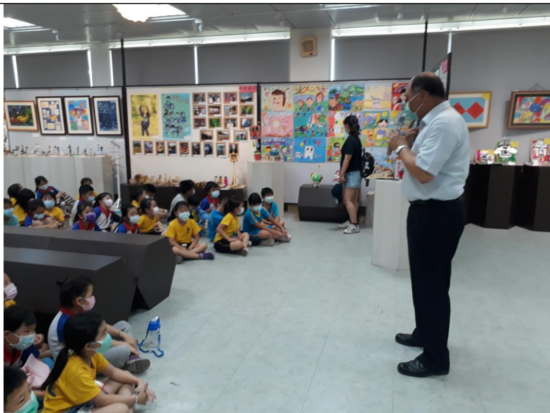
109年5月9日水里鄉各級學校學生聯合美展，水里國小學童參觀，徐校長致詞。