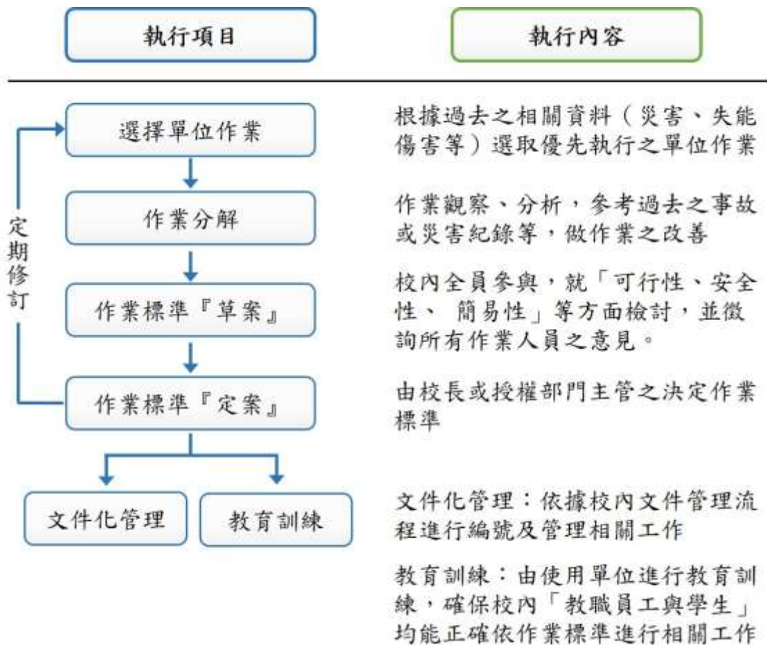
圖一 安全作業標準製作步驟